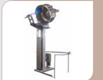
• Hebekipper / Rotierender Kessel und Abstreifer