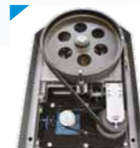
• Mechanische Getriebeuntersetzung durch Riemenscheiben und Riemen