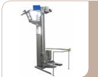
• Kesselheber mit einem oder zwei Armen